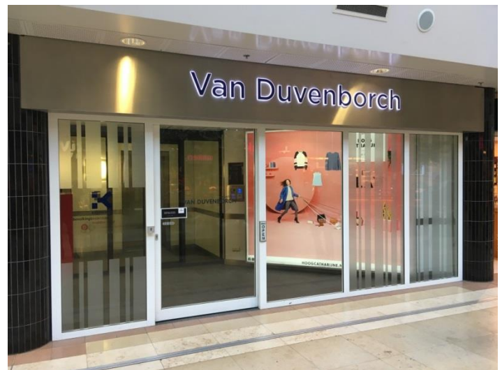
De ingang van het onderzoekscentrum.